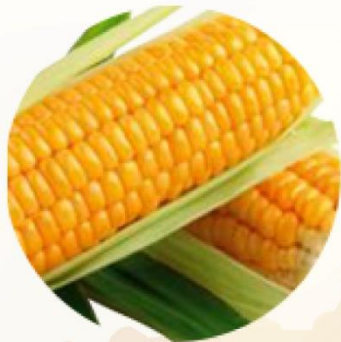
aminokyseliny kukuřičného glutenu