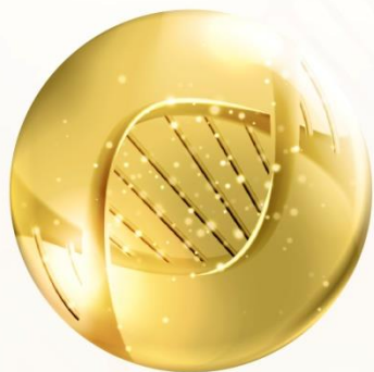
nanokomplex peptidů Matrixyl 3000