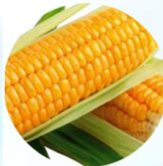
aminokyseliny kukuřičného glutenu